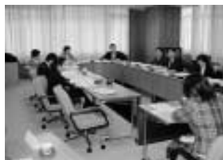
2月7日川崎市役所にて

◇8月21日から佐賀県警に犯罪被害者支援について、被害者支援を創る会の仲間達と視察に行く予定です。今回は入校に間に合わないため、次号で紹介したいと思います。