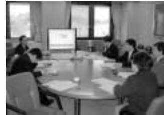
2月8日横須賀市役所にて